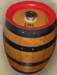
Fass mit Eisenreifen