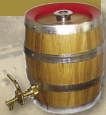
Fass mit verzinktem Reifen

mit Edelstahlblase zur Keg-Befüllung. Blase in Fass eingeschäumt, bayr. Anstich (mit Schrödelbüchse, Kugelventil und Federverschluss), Fitting nach Wahl, mit schwarzen oder verzinkten Reifen, Fassköpfe nach Wunsch. Die Fässer sind aus kammergetrocknetem Eichenholz hergestellt. Das Holz kann daher nicht mehr schwinden und sie müssen nicht wie direkt befallte Holzfässer nass gehalten werden. Die Reifen der Fässer sind angeschraubt und können nicht herunterfallen. Sehr gute Kälteisolierung durch das Eichenholz. Auch mit herkömmlichem Spundloch lieferbar (ab 5 Ltr.).