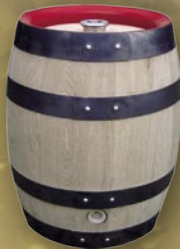
Fass mit Schrödel