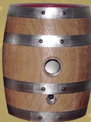
Fass mit Spundloch